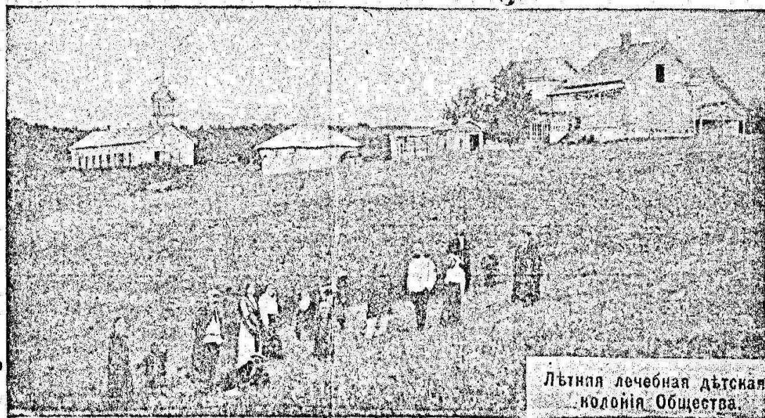
Лѣтняя дѣтская лечебная колонія Общества въ Самарской губ.

Если Вы любите дѣтей не дайте имъ сдѣлаться дѣтьми улицы.