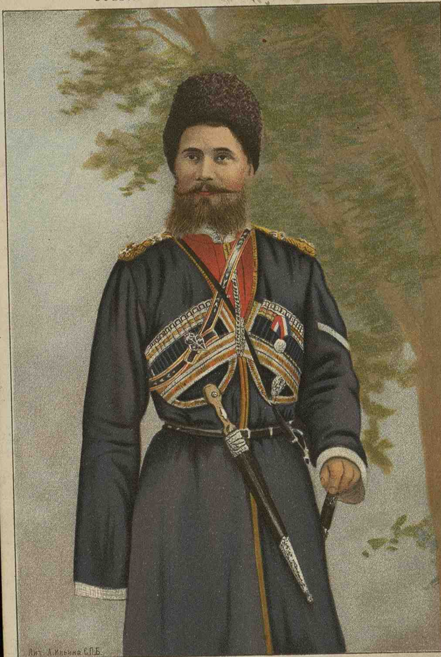
КОНВОЕЦЪ (КУБАНЕЦЪ). COSAQUE (DU KOUBAN) DE L'ESCORTE DE S. M. L' EMPEREUR.

НИЖНІЕ ЧИНЫ ИМПЕРАТОРСКОЙ ГВАРДІИ. SOLDATS DE LA GARDE IMPÉRIALE.